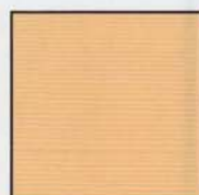
Ocre (RAL 1011)