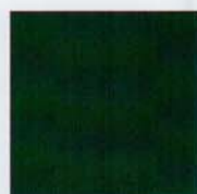
Verde (RAL 6009)