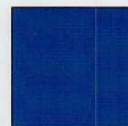
Azul (RAL 5008)