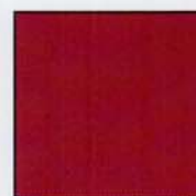
Burdeos (RAL 3004)