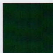
Verde (RAL 6009)