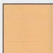
Ocre (RAL 1011)