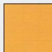
Oro Anodizado = ■